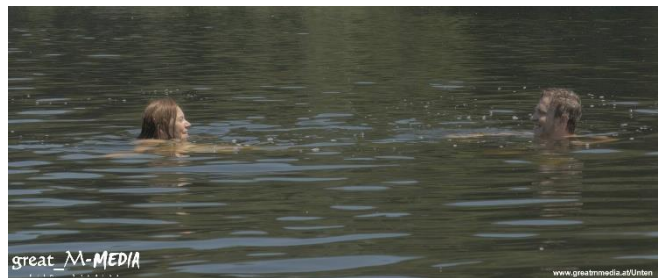
Leah (Kristina Kahlert) und Adrian (Lukas Bischof) beim Schwimmen im See

Adrian - ein junger Student - in seinem Fachgebiet Elektrotechnik äußerst erfolgreich und Leah - eine Biologiestudentin – durch die geheimnisvolle Art von Adrian magisch angezogen, kommen sich in der Schule und später auf einer Party näher. Die Chemie zwischen den beiden scheint zu stimmen und so beschließt Adrian, Leah in ein Geheimnis einzuweihen. Nachdem die beiden zum Schwimmen in einem See im Salzkammergut waren, überredet Adrian Leah mitzukommen. Er führt sie mit verbundenen Augen in sein Haus.